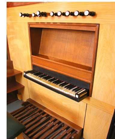
Het domein van de organist

Het kon niet anders, dan dat het orgel veel te lijden had van het intensieve werk aan het kerkinterieur. Er deden zich dan ook allerlei gebreken voor. In deze periode werden al gesprekken gevoerd met ondergetekende om tot restauratie van het orgel te komen. In begin 2004 werd door mij een eerste beleidsrapport namens de Commissie Orgelzaken van de PKN uitgebracht. Naar aanleiding daarvan is de restauratieprocedure gestart.