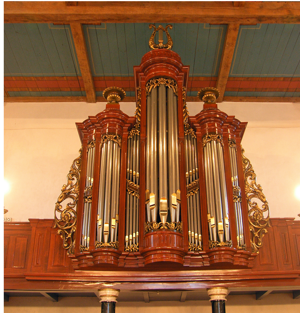
VAN OECKELEN ORGEL IN DE DORPSKERK TE VRIES STEF TUINSTR